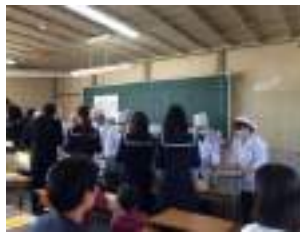
なつかしの学校給食

なつかしの学校給食では、旧遷喬尋常小学校の活用の観点から、学校給食の後に唱歌等を歌う「音楽の授業」を組み込んだ特別メニューの学校給食も開催するよう計画します。