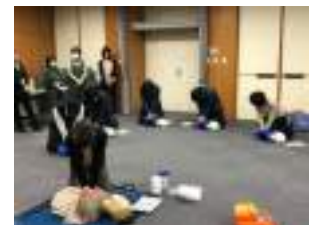
AED・心肺蘇生法研修会

利用者の安全を確保するため、自然災害等が発生した場合の対応マニュアルを整備し、避難訓練、AED研修会等を定期的に行います。また、エスパスセンターは真庭市の避難所に指定されており、災害時等の施設利用の協力に関する協定を締結し、万一の事態に備えます。