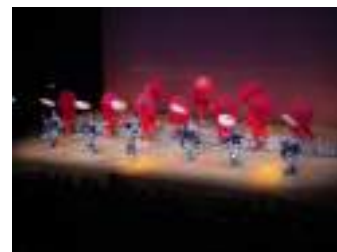
宮坂流銭太鼓エスパス公演