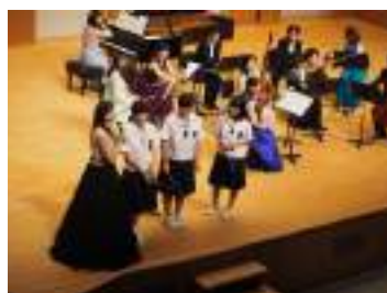
小中学校へのプレゼントコンサート