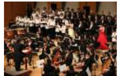
エスパ第九演奏会