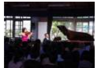
旧遷喬尋常小学校講堂コンサート