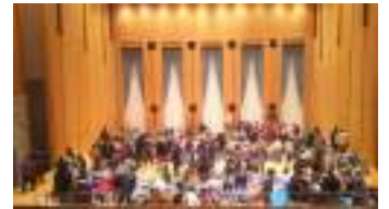
エスパス館内フリーマーケット