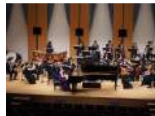
管弦楽団定期演奏会