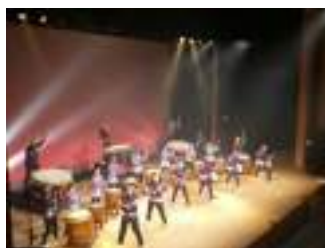
早川太鼓エスパス公演